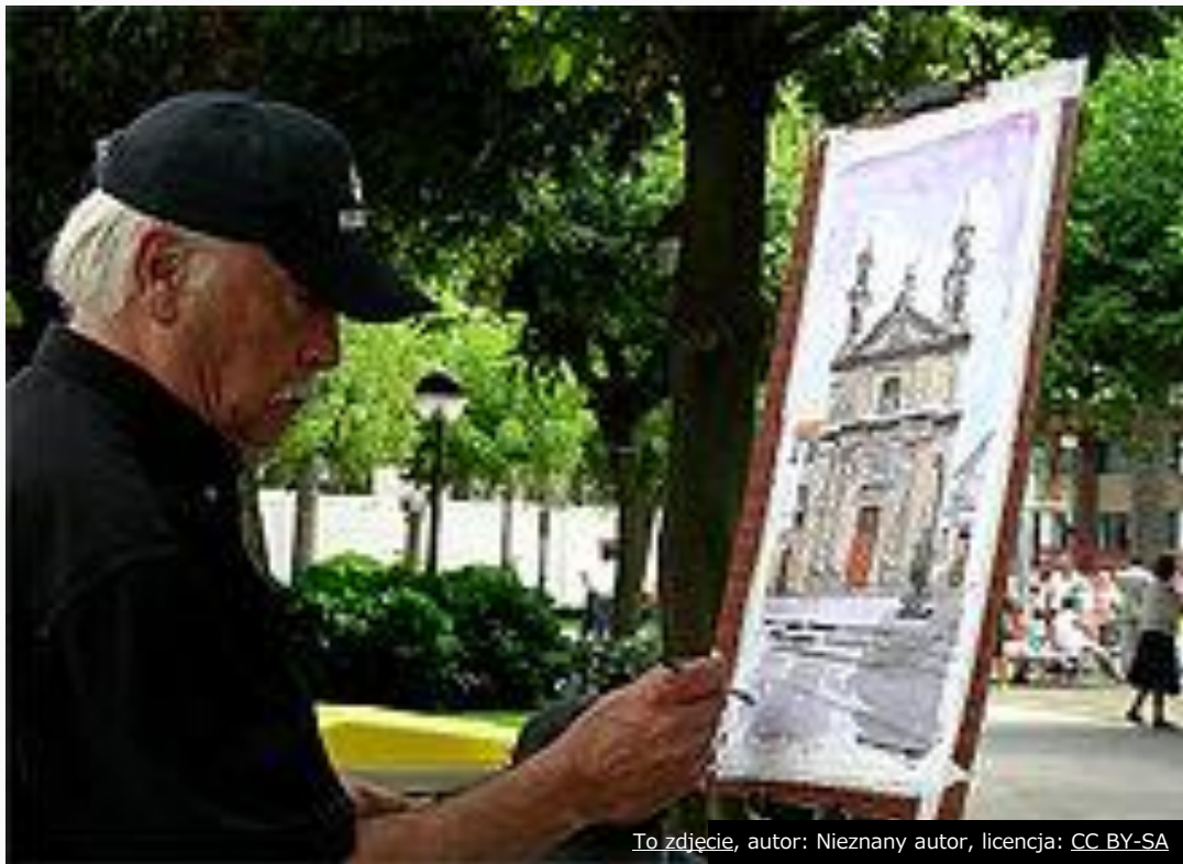
To zdjęcie, autor: Nieznany autor, licencja: CC BY-SA